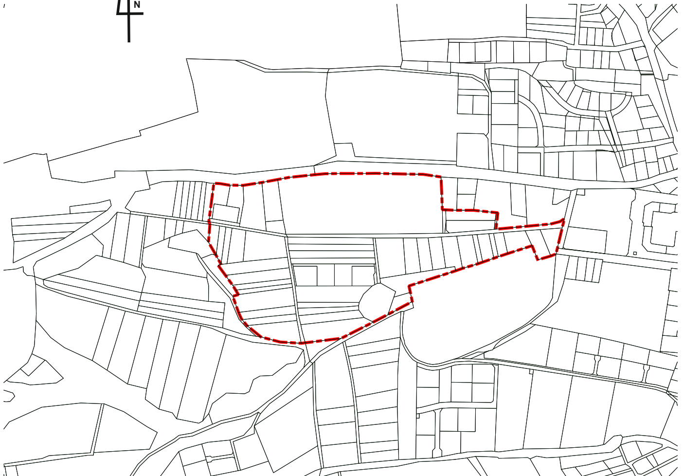
STUDIUM UWARUNKOWAŃ I KIERUNKÓW ZAGOSPODAROWANIA PRZESTRZENNEGO GMINY TRZEBNICA