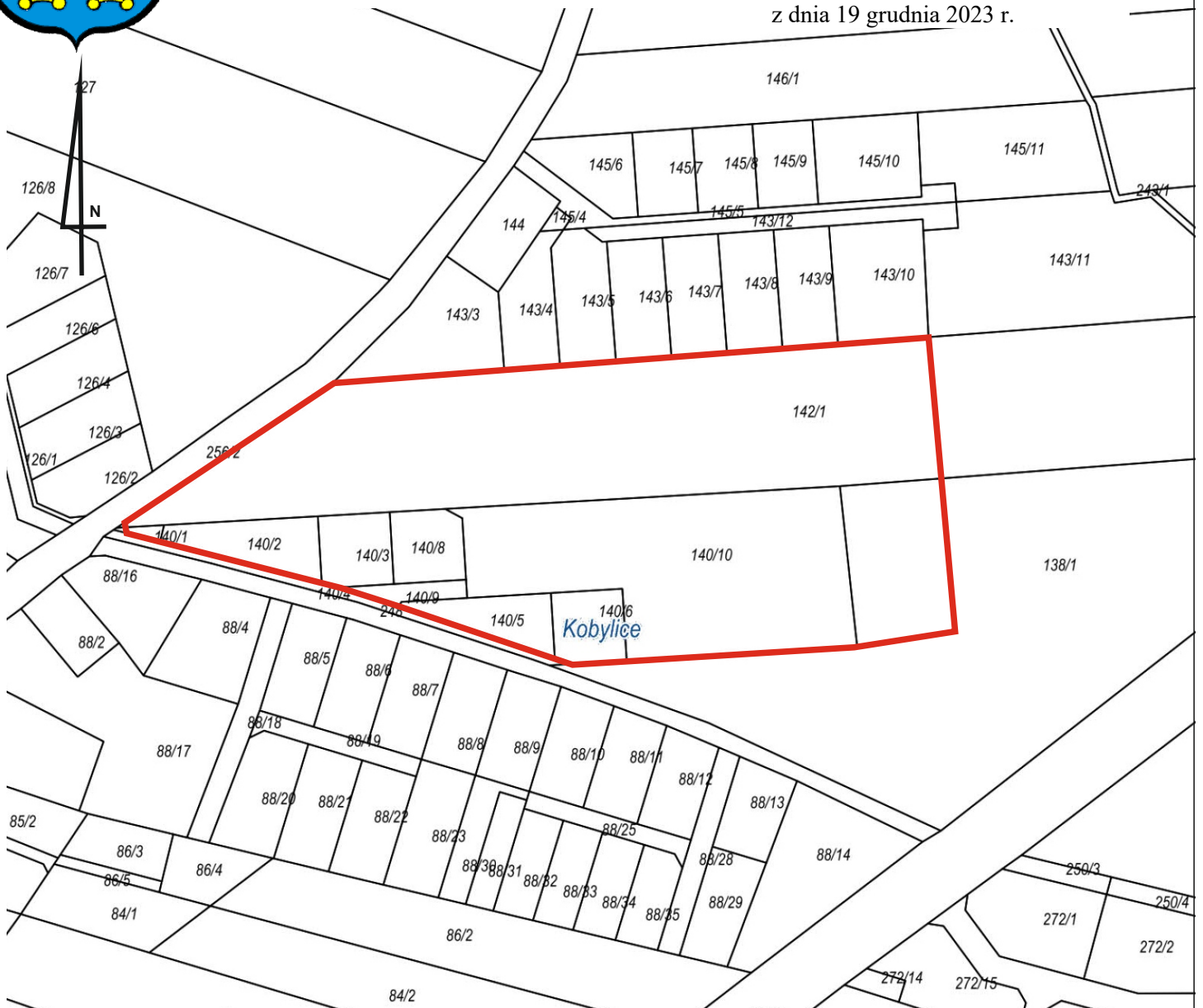
MIEJSCOWY PLAN ZAGOSPODAROWANIA PRZESTRZENNEGO WSI KOBYLICE - CZĘŚĆ A (Uchwała nr XLV/458/22 z dnia 29.11.2022r.)