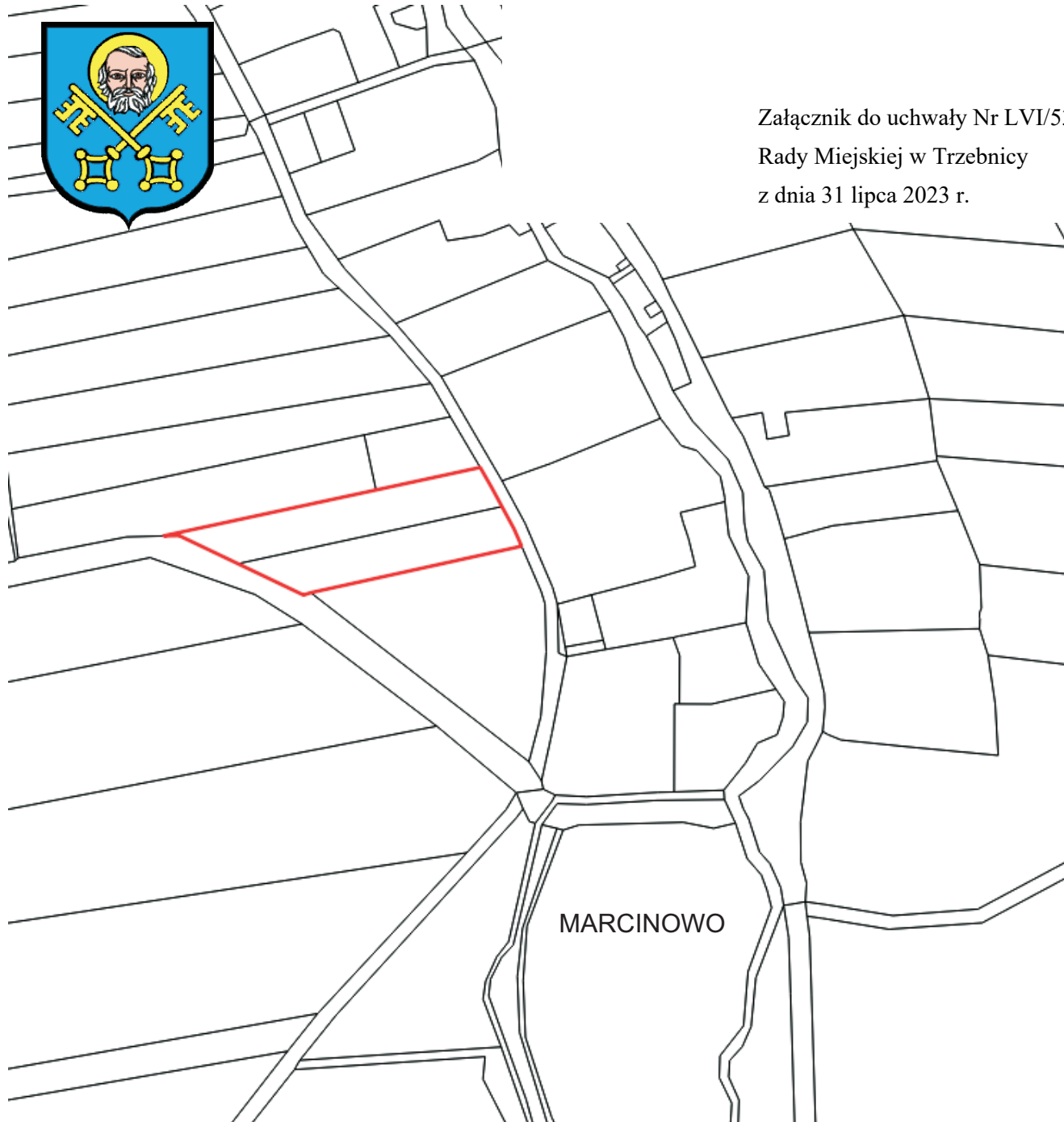
Studium uwarunkowań i kierunków zagospodarowania przestrzennego gminy Trzebnica

Załącznik do uchwały Nr LVI/532/23 Rady Miejskiej w Trzebnicy z dnia 31 lipca 2023 r.