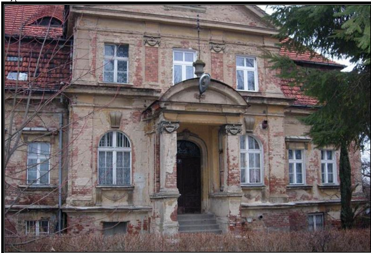
Zdjęcie 1 Pałac w Raszowie