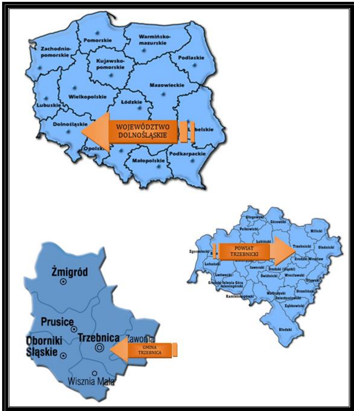
Mapa 4 Lokalizacja Gminy Trzebnica na tle Polski, województwa i powiatu

Raszów jest sołectwem i stanowi jednostkę pomocniczą Gminy Trzebnica. Gmina ta jest jedną z sześciu gmin Powiatu Trzebnickiego. Powiat Trzebnicki położony jest w województwie dolnośląskim.