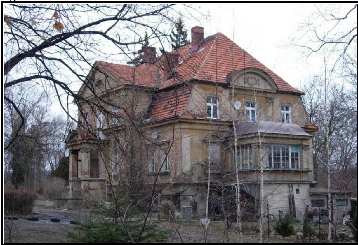
Zdjęcie 2 Pałac w Raszowie