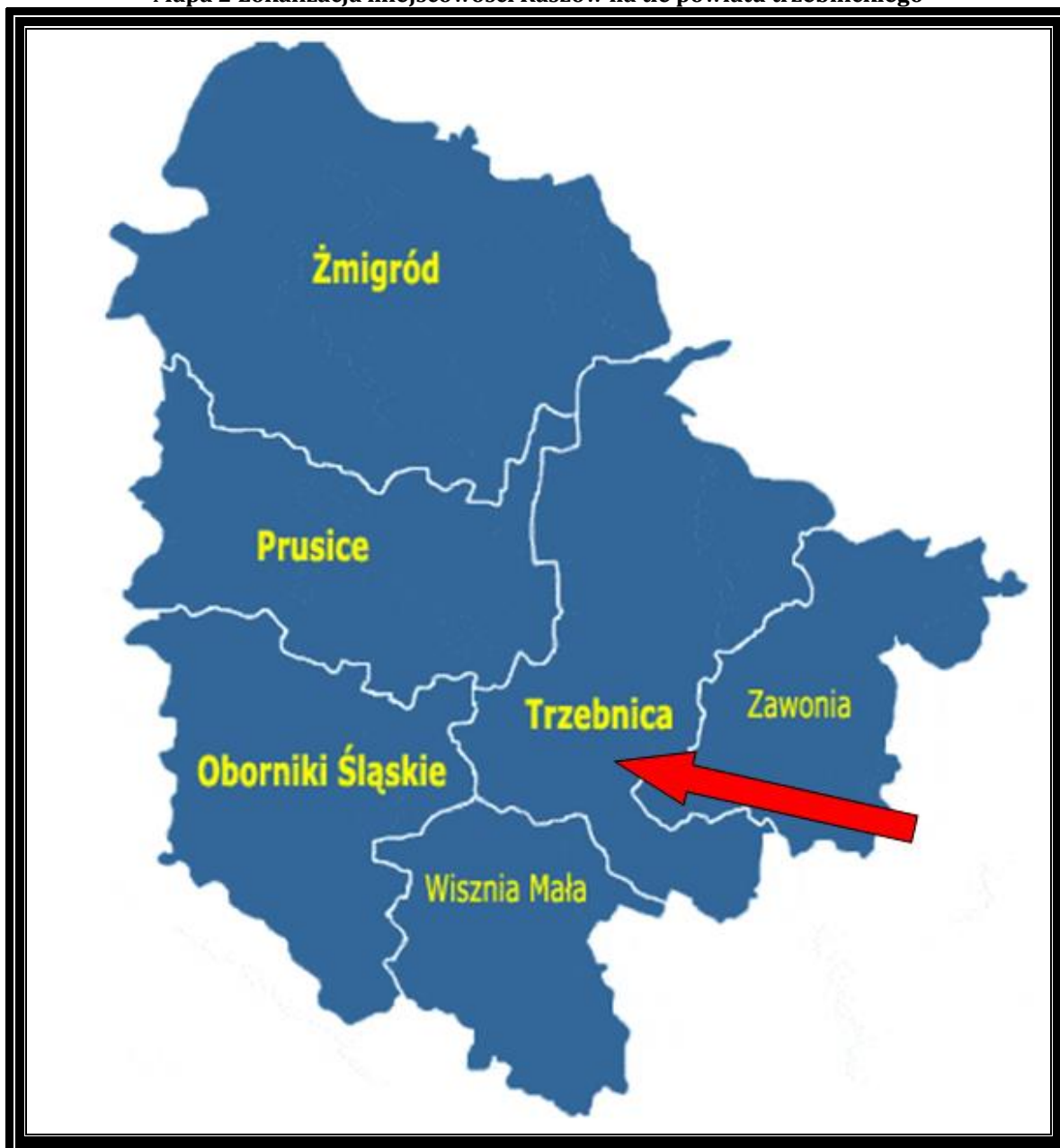
Mapa 2 Lokalizacja miejscowości Raszków na tle powiatu trzebnickiego