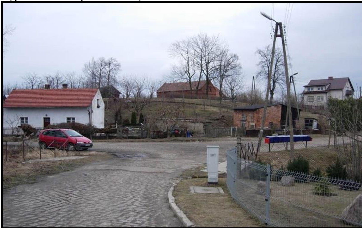
Zdjęcie 3 Główne skrzyżowanie w miejscowości Raszków