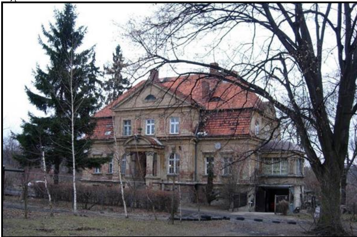
Zdjęcie 4 Pałac w Raszowie