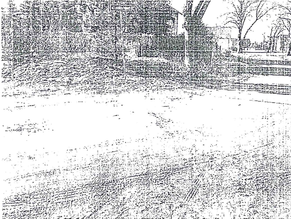
fot. 1 – Wjazd na ulicę Lotników Polskich z głównej drogi w Kobylicach