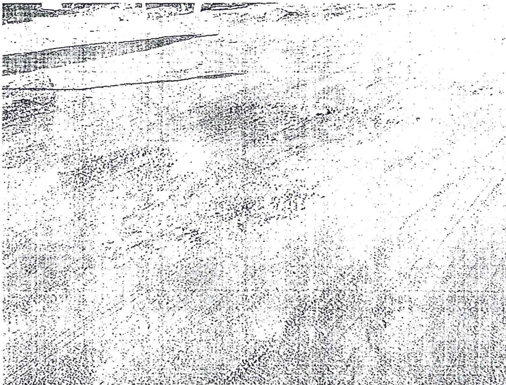
fot. 3 – Przykład ubytków w drodze przy wjazdach na posesje mieszkańców