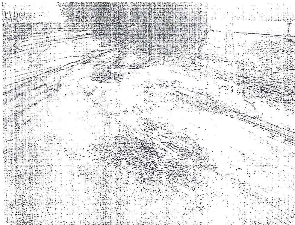
fot. 2 – Znaczące ubytki na ulicy Lotników Polskich przy wjeździe z głównej drogi w Kobylicach