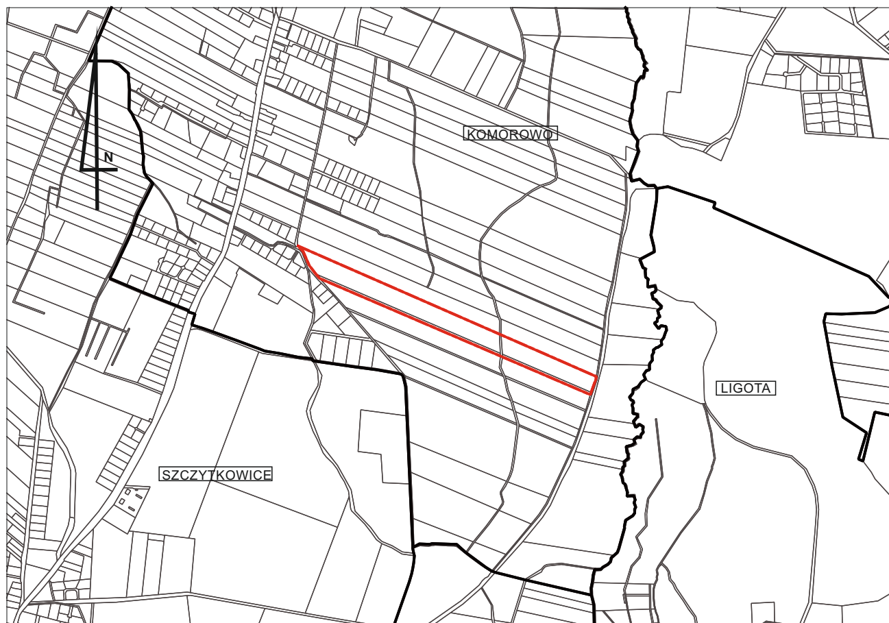
MIEJSCOWY PLAN ZAGOSPODAROWANIA PRZESTRZENNEGO DLA DZIAŁEK NR 22/1, 23/1, 24 I 25 POŁOŻONYCH W OBRĘBIE KOMOROWO GM. TRZEBNICA (z 2002 r.)